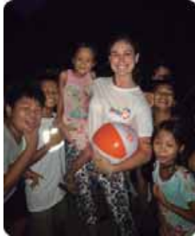
Reparto de balones y globos