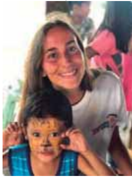
Taller de pintacaras