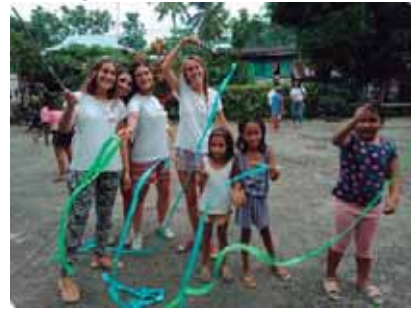
Juegos con cintas de colores